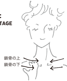
【デコルテのマッサージの方向】

手をグーにして、指の第2関節で各部位を軽くなぞり、リンパを流します。(以下、同じ手順です)