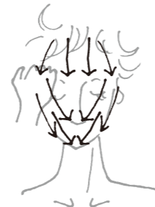
【お顔のマッサージの方向】