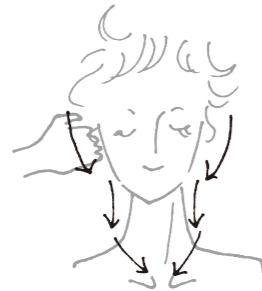
【耳から首へのマッサージの方向】